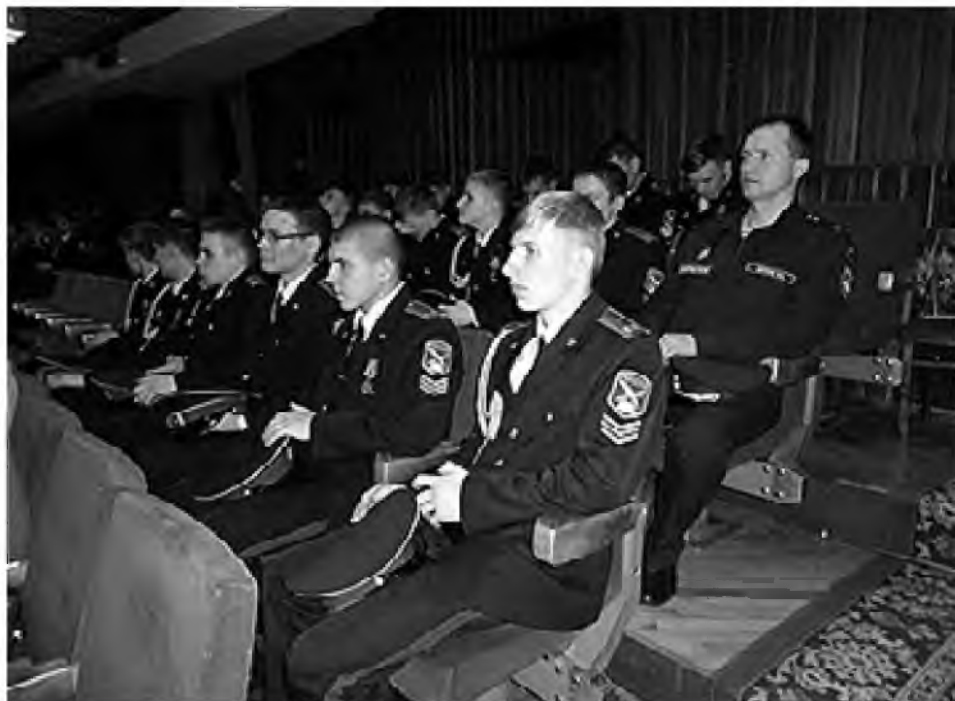
Пятая и шестая рота в Омском Государственном Музыкальном Театре